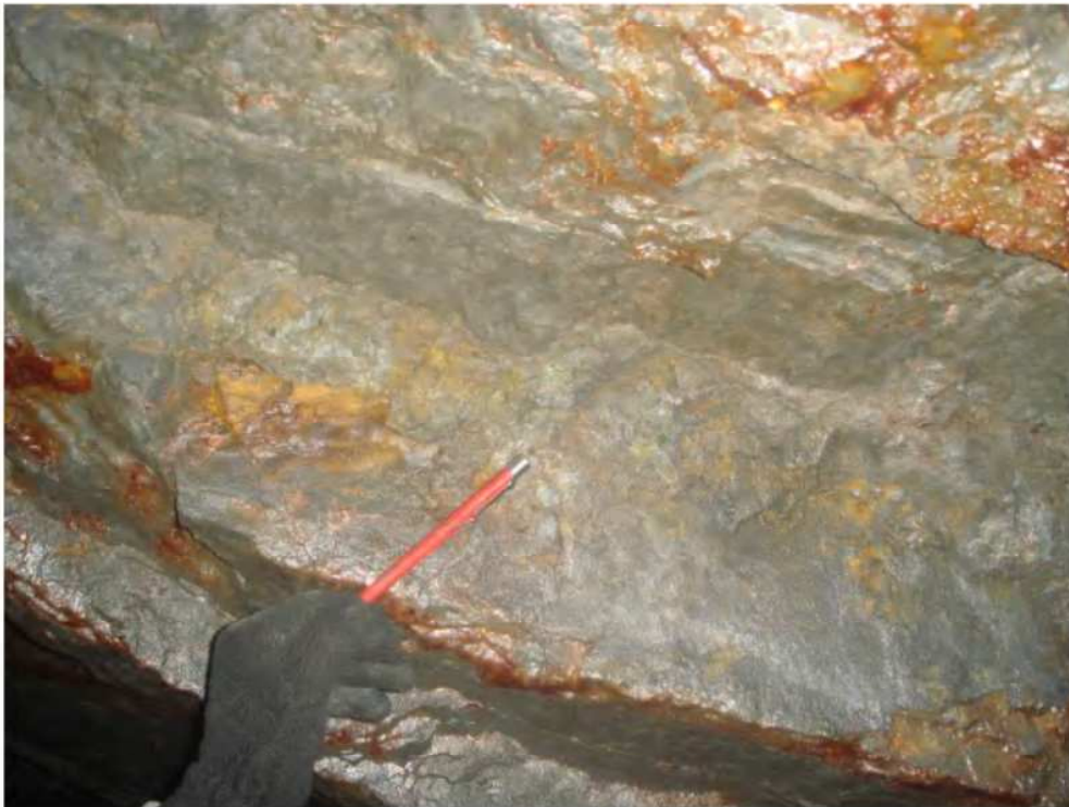
Pizarras y mantos con mineralizaciones de oro de la Galería Cenzacor en La Mina Ananea (La Rinconada - Puno)