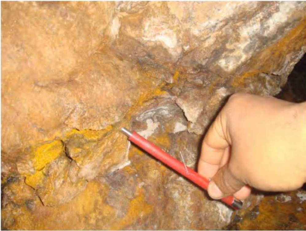
Foto 2.- Relleno de falla mineralizada de Mina Santa Rosa