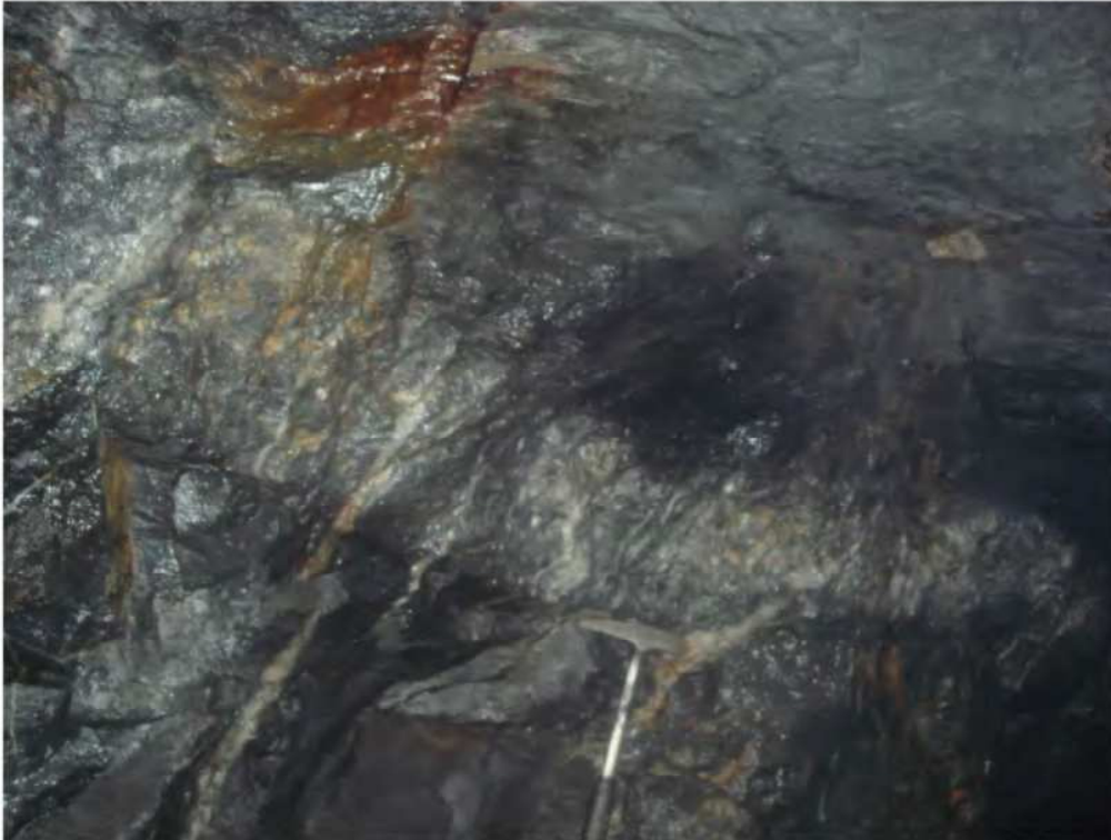
Foto 1.- Mina Ananea. Manto cortado por vetillas de cuarzo.