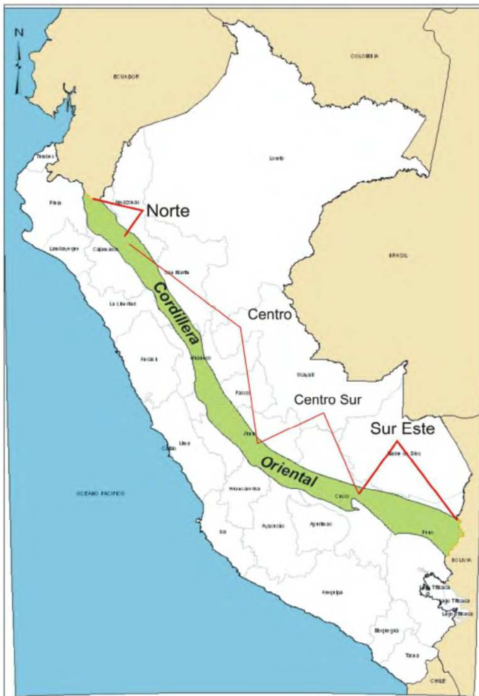
Fig. 1, Mapa de ubicación y división de la Cordillera Oriental